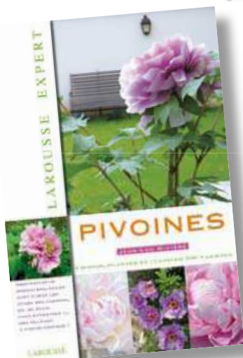
PIVOINES LAROUSSE EXPERT

500 variétés de Pivoines sélectionnées et présentées par Jean-Luc Rivière