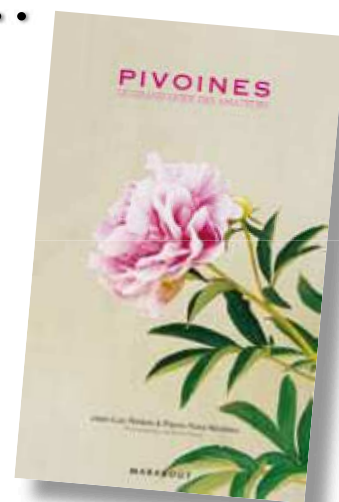
PIVOINES Le grand Guide des amateurs MARABOUT

Prix : 16,90 € pour une expédition avec des pivoines Prix : (16,90 + 7,00) = 23,90 € pour une expédition livre seul